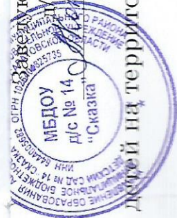
Схема организации движения и маршруты движения детей на территории МБДОУ д/с № 14 «Сказка»

Составляющая МБДОУ д/с № 14 «Сказка» Л.И.Котлова